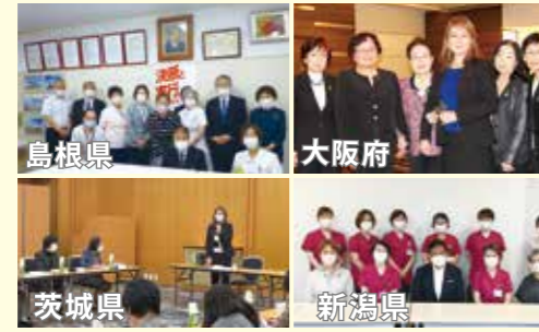
研修や講演を通して地道に現場の声を政策へと反映しています。