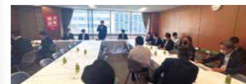
TICAD8 に向け、国際保健協力や資源エネルギー開発支援の強化を提言