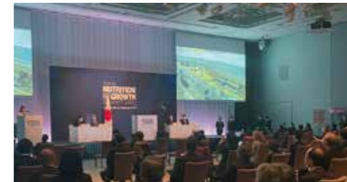
世界65カ国215団体が参加し、健康・食・強靱性について議論