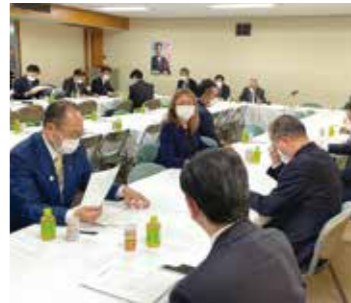
離島振興法の改正・延長に関する決議を採択!必ず実現しましょう。