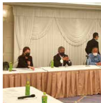
事業継続に深刻な影響を被っている宿泊等観光関連分野への支援を急ぎます。