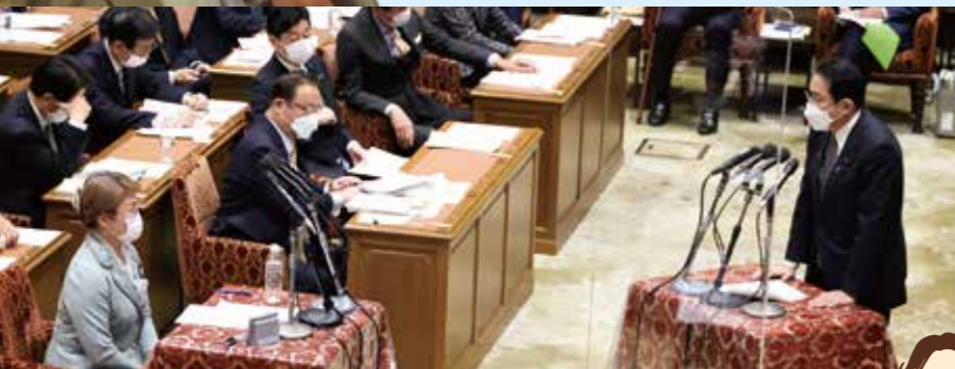
令和4年度予算に係る集中審議 (TV生放送) で、党を代表して総理に質問しました。