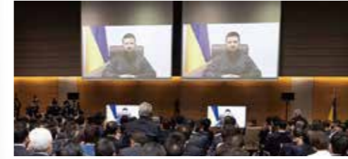
ウクライナ侵略の早期停止に向けて