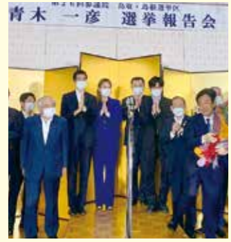
第26回通常選挙で全国各地へ応援遊説、見事な勝利に湧きました。