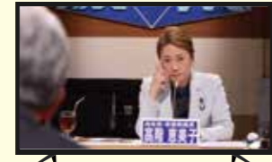
政府の感染症対策について、各分野の論者と討論