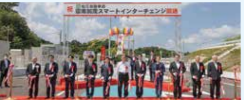
北部エリアの新たな玄関口は国内最新の設備整備。移動円滑化・物流安定化・産業活性化が期待されています。