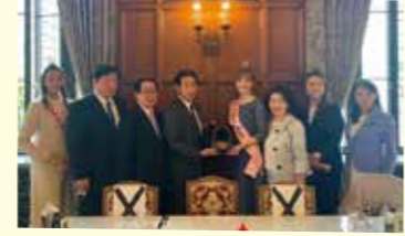
議員外交が制約されるなか、うれしい訪問を受けました。