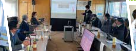
隠岐諸島の海士町を訪ね、医療福祉の充実と文教科分野の振興策について意見交換しました。