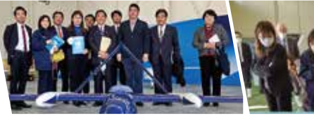
衆議院の特別委員会で商工観光業や水産加工業の現状を視察。水揚げされる魚種変化への対応も新たなテーマです。