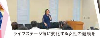
ライフステージ毎に変化する女性の健康を考慮した支援策が期待されています。