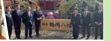
ヘルス&コミュニティ議連では、先進的なスマートウェルネスシティを視察し、その取り組みを後押ししています。