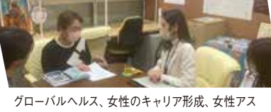
グローバルヘルス、女性のキャリア形成、女性アスリート支援など様々な分野から関心が集まっています。