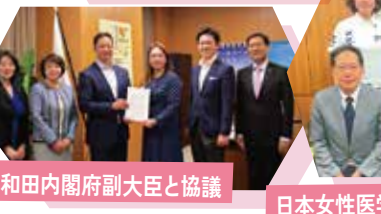
和田内閣府副大臣と協議