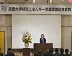
専門人材育成と地域産業振興をめざす国内初の材料エネルギー学部が国立大学に設置され、国内外から熱い期待が寄せられています。