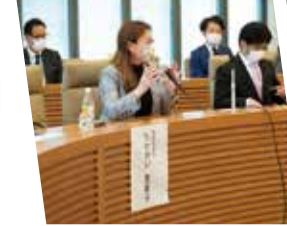
先進諸国では受動喫煙防止と同時に、喫煙者の健康被害を低減させる政策が強化されています。国際会議で知見を共有!