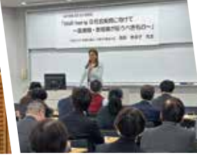
近畿圏で医療福祉人材を育成する教職員とともに、well-beingな社会づくりにつながる教授法について意見交換しました。