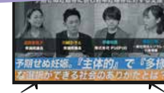
赤塚タトウで若年妊婦の不安や性に関する質問について語ろう。