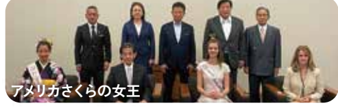
アメリカさくらの女王