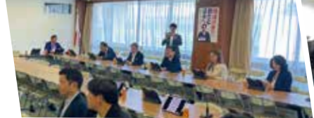
党の特別委員会で被災地の情報収集と自治体からの意見を基に、豪雨災害への緊急対応を決議。