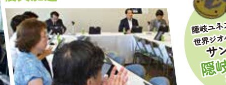
ALPS処理水の海洋放出に伴う周辺環境の整備支援と適切な対応を進めます。