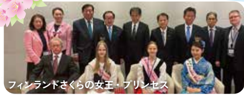
フィンランドさくらの女王・プリンセス

さくら振興議連・日本さくらの 会評議員として、海外からさく らの女王・プリンセスを招聘。 両国の友好親善に 努めています。