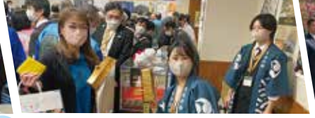
佐渡の日(3/10)に、世界遺産登録に向けて金山をPR。