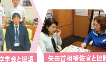
日本女性医学学会と協議