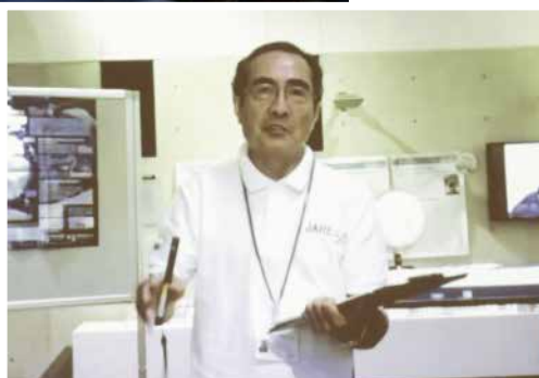
国立極地研究所の本吉洋一特任教授