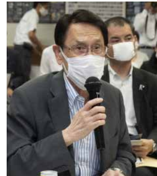
渡海紀三朗科学技術・ イノベーション戦略調査会長