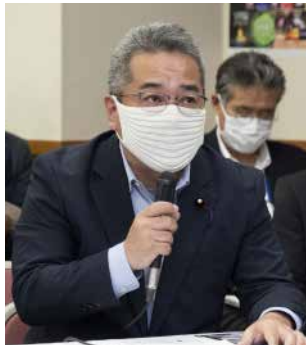
青山周平文部科学大臣政務官