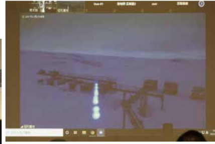
昭和基地から中継された南極大陸の様子